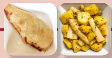
Hähnchen-Fleisch Spargel Kartoffeln