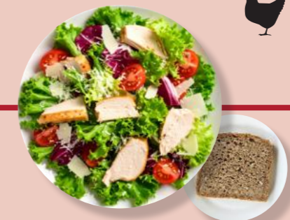
Salat Puten Parmesan-Käse Brot