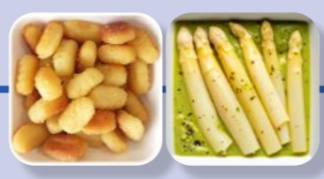
Gnocchi Spargel-Ragout Kerbel-Soße