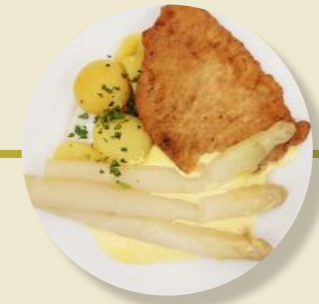
Schweine-Schnitzel Spargel Holländische Soße Kartoffeln