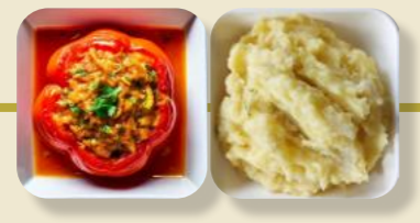
Gefüllte Paprika Tomaten-Soße Kartoffel-Brei