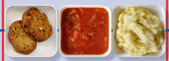
Bulette aus Quinoa und Erbsen Paprika-Soße Kartoffel-Brei