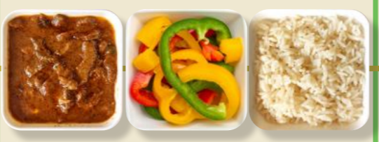
Geschnetzeltes Paprika Reis