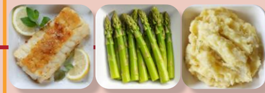
Fisch-Filet Grüner Spargel Tomaten Kartoffel-Brei