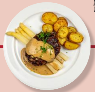
Hack-Steak Gebratener Spargel Butter-Soße Kartoffeln