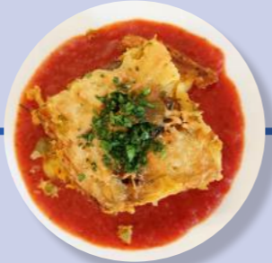
Nudel-Auflauf Gemüse Tomaten-Soße