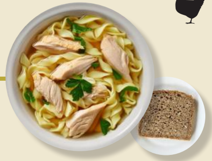
Brüh-Nudeln Hühner-Fleisch Brot