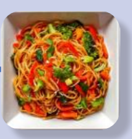
Asiatische Nudeln Gemüse