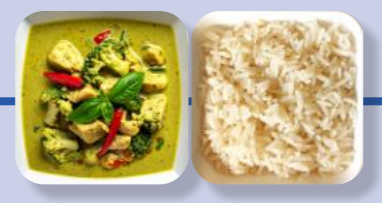
Vegetarisches Thai-Curry Reis