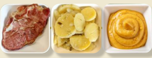
Kassler Kartoffel-Salat Senf