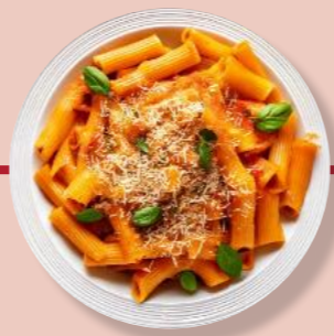
Rigatoni-Nudeln Würzige Tomaten-Soße Puten-Fleisch Käse