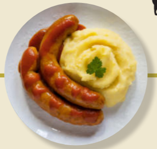
Curry-Wurst Soße Kartoffel-Brei