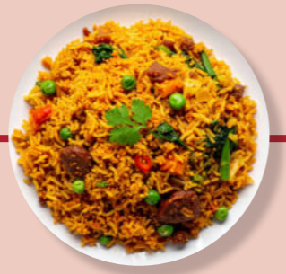
Nasi Goreng Puten-Fleisch Reis