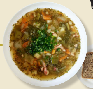
Gemüse-Eintopf Speck-Streifen Brot