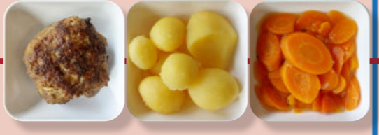
Bulette Kartoffeln Möhren