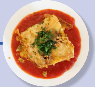
Vegetarische Lasagne Mozzarella-Käse Tomaten