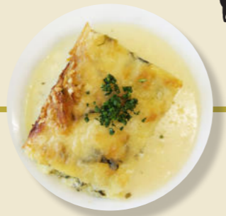
Auflauf mit Hack-Fleisch Mozzarella-Käse Nudeln