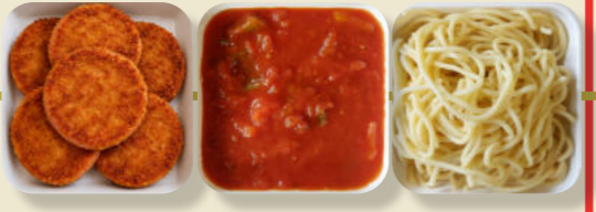
DDR-Jäger-Schnitzel Tomaten-Soße Spagetti