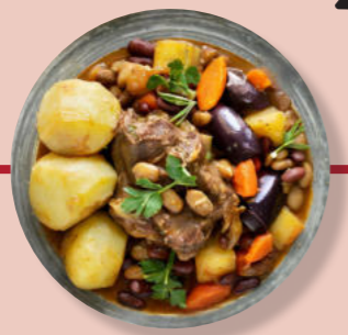
Lamm-Topf Kartoffeln Aubergine Zucchini