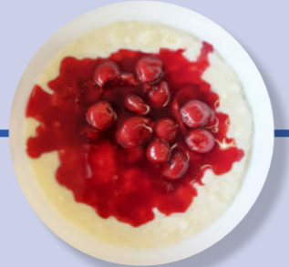
Milch-Reis Heiße Kirschen