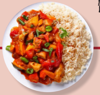
Hähnchen-Fleisch Paprika Reis