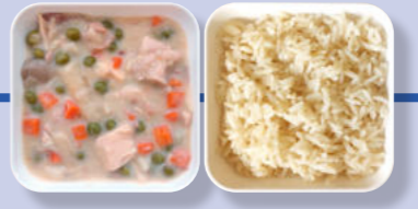
Veganes Hühner-Frikassee Reis