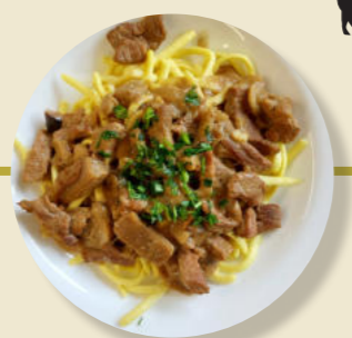
Schweine-Geschnetzeltes Pilze Spätzle