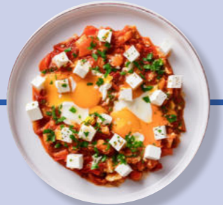
Shak-Shuka aus Ei und Tomate Feta-Käse