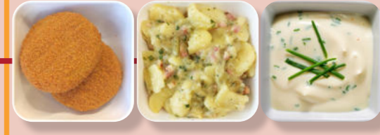
Fisch-Bulette Kartoffel-Salat Remouladen-Soße